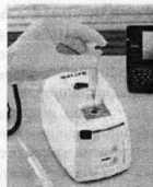
1. Вставить использованную иглу не снимая со шприца.