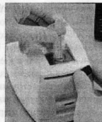
2. Нажать до полного сгорания иглы, отрезать канюлю шприца ножом.